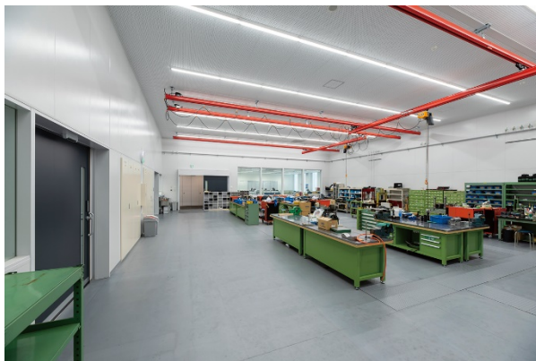
断熱性能・遮音性を高め、室内環境への外的影響を抑えた1F作業場と精密測定室