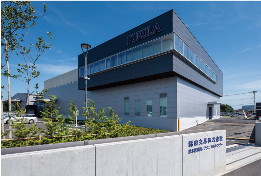
室内への環境負荷低減のため閉じた1F工場部分と開放的な2F部分のシンプルな外観