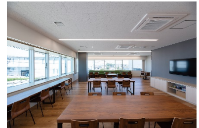
富士山を望む開放的な2F食堂室